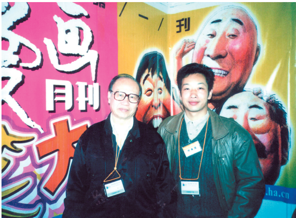
漫画大师方成(左)与李润泉合影。