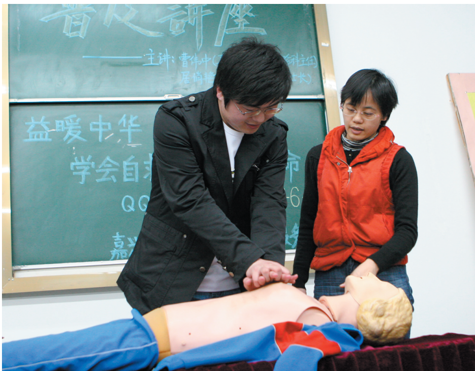
3月20日晚,学校幸运星志愿者协会联手附属一院在子西201教室举行“学会自救,珍爱生命——灾难自救常识接力”公益讲座,普及自救常识。