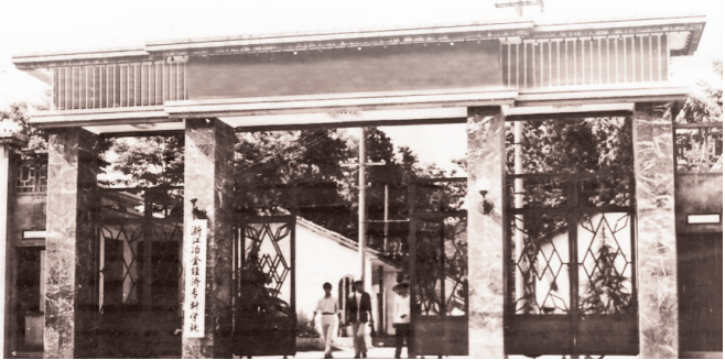
浙江冶专校门(梅城)

我校前身是一所中专学校,即浙江冶金学校,属冶金部管辖。1978年12月,学校被教育部批准升格为大专,即浙江冶金专科学校。这是全国教育的春天,也是我们学校的春天,从此,学校步入大学行列。我们当时都是中专的老师,学校升格了,中专老师转变为大专老师,都必须进修提高。我也一样,去过北京经济学院学习,后来考取杭州大学,取得专科学历,从中专教师顺利转型为大专教师。这是历史的机遇,也是我自己发展的机会。从次,我开始了大学的教学管理