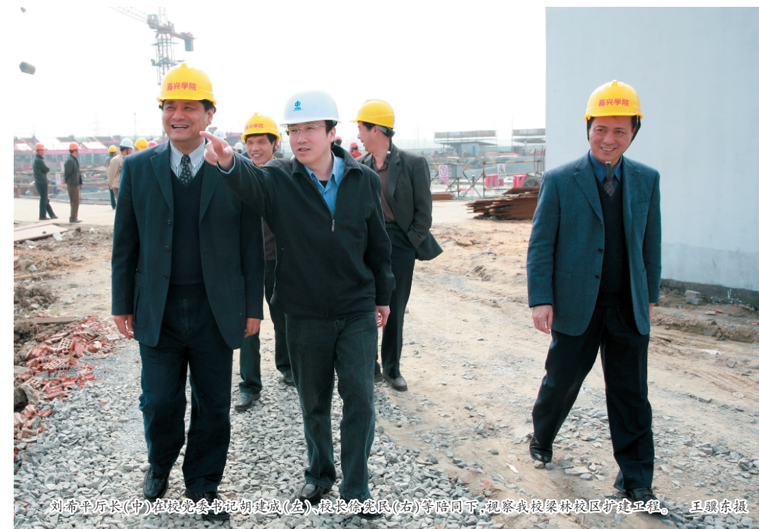
刘希平厅长(中)在校党委书记胡建成(左)、校长徐宪民(右)等陪同下,视察我校梁林校区扩建工程。

刘希平强调,高校为地方“经济转型、结构调整”服务是大学的重要职能之一,高校在做好地方服务这篇文章上的认识要深化,视野要拓展。对于高