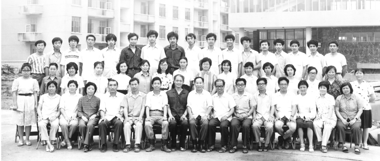
浙江冶金首批赴嘉兴分校工作的教职工合影 87.7.

往事如烟,23个冬尽春回,我看着校园的一栋栋楼宇建起,看着一棵棵小树长大;23个暑去秋来,我送走了一批批优秀的毕业生,又迎来了一批批可爱的新同学。抚今追昔,学校的每一点发展都融入了我的情感,而我的每一点进步也都融入了学校的发展。