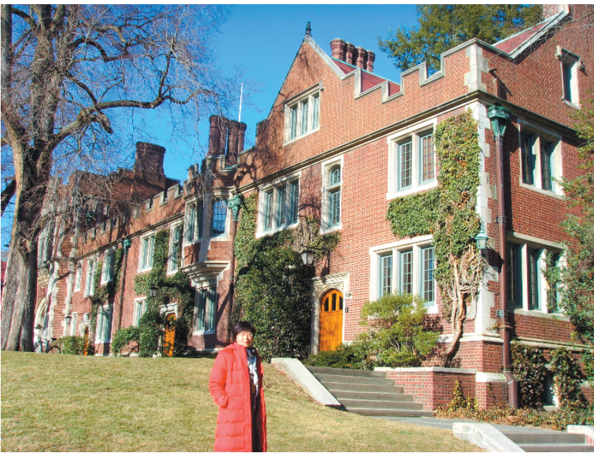
作者在普林斯顿大学校园

第一、以培养学生为核心的大学问责制。 问责制首先应用于对政府官员的行政问责,其最终目的是要从积极预防的角度实现权责的统一,保证管理活动基本目标的实现。随着西方教育民主化进程的推进,问责制也被逐渐引入教育管理