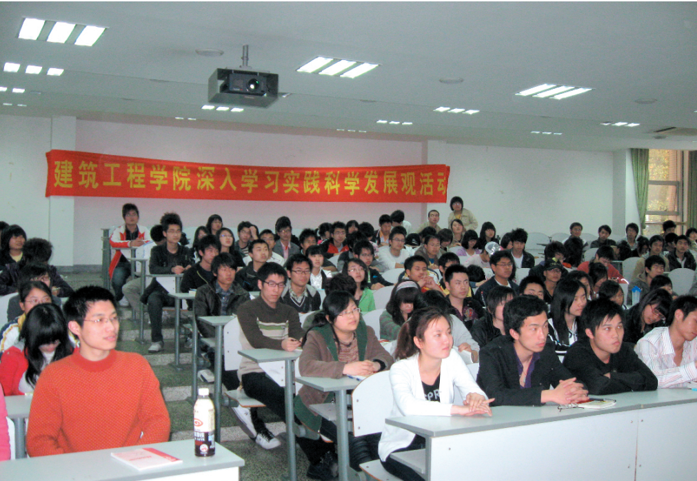
■记者 王辉 通讯员 阮雪琴

党的创新理论富有无穷魅力,基础是学习,核心是信仰,关键是践行。为了能让所有学生党员动起来,为了能让学习、信仰、践行有效地结合,建筑工程学院学生党支部将民主生活会和深入学习实践科学发展观活动紧密结合起来,将党的活动和同学自身发展联系起来,引导他们树立正确的就业观,明确身上肩负的责任和使命。