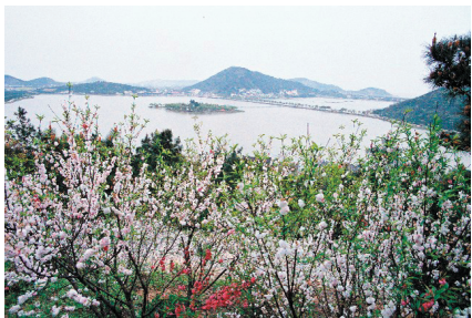
澉浦南北湖