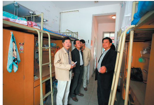
指导检查组一行走访学生公寓。