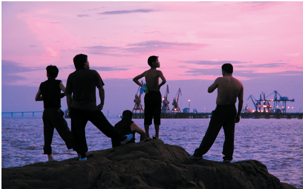
乍浦港灿烂的晚霞