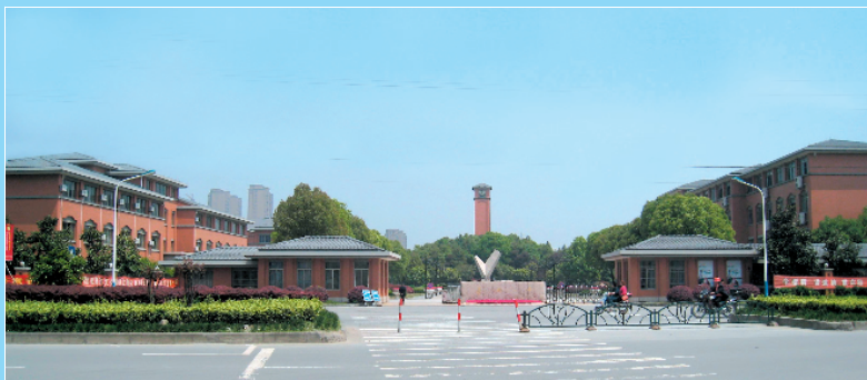
嘉兴市第一中学行政科技楼