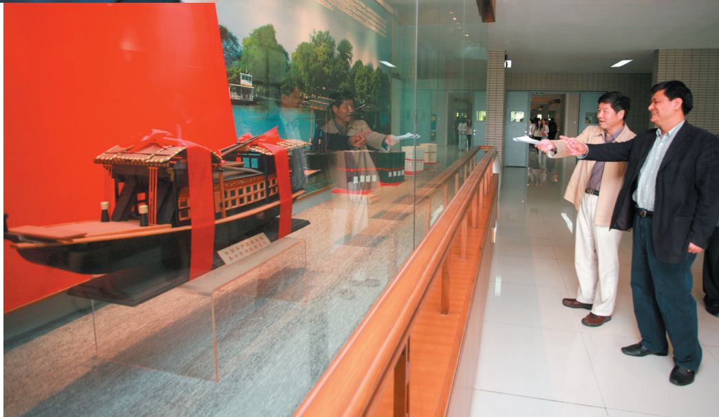
指导检查组一行参观校文化长廊。

4月27日,省委指导检查组一行来校指导学习实践活动转段工作,听取学校上阶段工作总结及下阶段工作思路汇报。