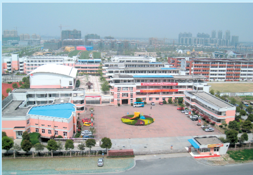
南湖国际实验学校