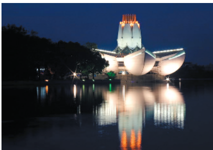
夜色中的东湖李叔同纪念馆