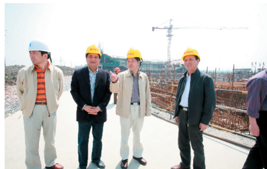
指导检查组一行深入梁林校区扩建工程现场进行指导。