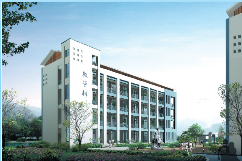
援川重建项目——在建的青川房石镇九年制学校(效果图)