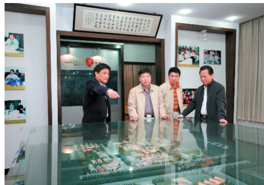
指导检查组一行参观校史陈列馆。