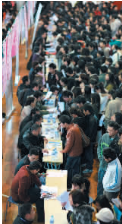
毕业生受到用人单位欢迎,校园招聘会场火热

后与德国、丹麦、美国、韩国等国家的多所高校签订合作办学协议,累计接收各国留学生266名,向韩国、丹麦等国家派出国际交换生37名,保送研究生3名,与德梅泽堡应用科学大学联合培养工商管理硕士(MBA)“名”。累计聘请外教来校任教66名,选派赴美国进行学术交流和培训教师54名。2007年学校荣获嘉兴市外事先进单位荣