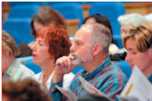
来自美国明尼苏达高校联合中国文化考察团的成员在我校听课