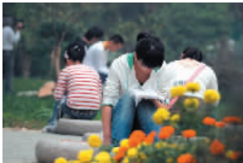
学风浓厚,校园晨读成了一道风景