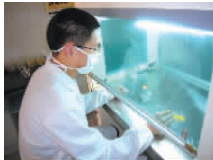
临床医学专业学生在做实验

为促进学风建设,医学院制定了《学生考勤与请假制度》、《学生操行纪实考评实施细则》、《学生综合素质测评实施方案》等制度;对学生进行始业教育、日常教育、临床实习前教育等专题教育;引入激励机制,调动学生学习积极性,设立了优秀学生奖学金,开展“三好学生”、“优秀毕业生”、“推优和建党工作”等评选;举办校友事迹报告会、学习经验交流会、毕业经验介绍会,实施学生技能考核、专业知识竞赛和操作技能比赛,培养学生的实践能力;择优安排毕业实习,择优推荐就业;组建各类学生社团,举办知识讲座,拓展学生知识面,提高学生的综合素质。上述各项措施,激发了学生的学习积极性,有力促进了学风建设。