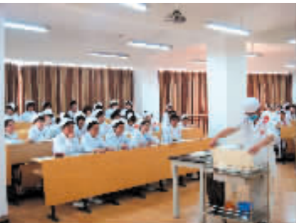
护士技能操作大赛——无菌操作

5月11日下午,护士操作技能大赛在医学实验楼进行,比赛列出4项内容:给氧、吸痰、无菌操作和心肺复苏,都是护士基本技能的考查,每一步操作过程均有明确严格的评判标准。