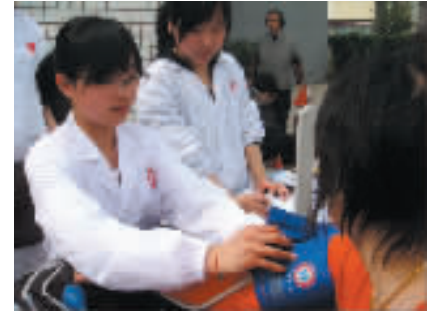
青年志愿者活动——为村民测量血压

4月27日,医学院临床医学N074班学生在高桥花园开展青年志愿者活动,凭借扎实的专业知识和娴熟的操作技能,为咨询者测血压,回答咨询,为社区群众讲解一些健康小常识,发放有关高血压等常见疾病的预防事项资料。