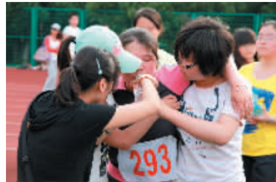
坚持到最后都是胜者