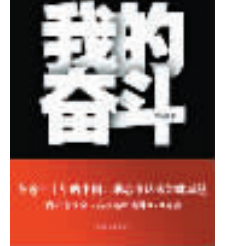
罗永浩著 云南人民出版社 2010年4月版

他上幼儿园的时候,就被老师描述成一个“思想特别复杂的孩子”,他在学校里跟制度对抗了九年,成为一个高中没毕业的小混混,然后,一直混到“中国第二著名的英语教师”、百度年度风云人物、牛博网创办人、“老罗培训”学校校长。读老罗的传奇经历,可以领悟如何用剽悍的内心创造传奇。这是罗永浩写的一本极具语言才华的自传,算是给剽悍的人生一个解释。