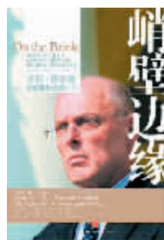
(美国)亨利·保尔森 中信出版社 2010年4月版

这是美国前财长亨利·保尔森真实的金融海啸记录。这本书记录了保尔森在金融动荡中的重大决策是如何作出的,不仅仅包括保尔森的个人回忆,也包括与美国前总统布什、美国现任总统奥巴马、美联储主席伯南克和现任财政部长盖特纳的会谈。保尔森在《崩溃边缘》一书中认为自己是自由市场的坚定支持者,他为自己