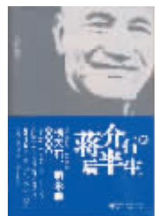
陈红红等著 浙江大学出版社 2010年4月版

中国有“盖棺论定”之说。人死之后,其历史地位基本就确定了。但重要的历史人物往往“盖棺”而不能“定论”,蒋介石即为一例,在他过世之时,海峡两岸对他的评价有着天壤之别。他过世30多年了,无论在政界还是学界围绕他的