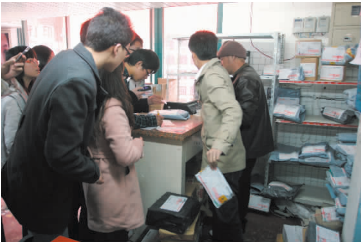
同学们排队拿快递