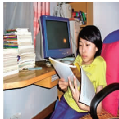
第四届“榜样之星——最具影响力青年”获得者

生化学院环境工程 081 班学生。 颁奖词: 这样一颗热忱的心,在如诗如歌的年华里,在追逐梦想的过程中,用她的坚毅和执着,展现着梦想的力量,青春的活力!