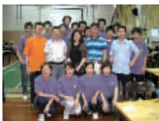
第四届“榜样之星——最具影响力青年”获得者