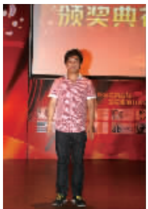
第四届“榜样之星——最具影响力青年”获得者