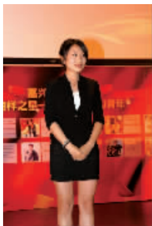
第四届“榜样之星——最具影响力青年”获得者