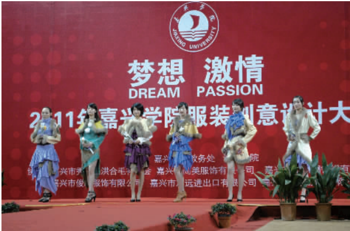
5月27日,嘉兴学院2011年设计专业毕业设计展演开幕式暨服装创意设计大赛在嘉兴体育馆举行。大赛共展示了服装设计与工程专业学生的31个系列作品,评选出金、银、铜奖及优秀作品奖多项,展出艺术设计、工业设计作品200余件。图为模特在大赛现场展示学生的服装设计作品。

谈到今年“挑战杯”的佳绩时,校团委书记陈立力老师露出了欣慰的笑容:“一直以来,我校非常重视学生创新精神和科技能力的培养,逐步形成了以‘挑战杯’竞赛为龙头,以‘浙江省大学生创新项目(新苗人才计划)’为孵化平台,以大学生社会实践为途径开展大学生科技创新活动的长效机制。‘挑战杯’竞赛作为学生科技文化活动中的重头戏,更是得到了学校相关部门和各学院的高度重视。”2010年11月份,校团委联合教务处部署本届“挑战杯”竞赛的各项组织工作后,就得到了各学院和同学们的积极响应,吸引了近1500名学生参与,共有120项作品申报,60项作品成功立项; (下转第二版)