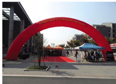
第五届数字信息文化节开幕式

学、追求卓越的文化氛围,有效促进了优良学风建设。优良的学风也有效地促进了学生学习的积极性、主动性的提高,也在一定程度上为学生积极参与学科竞赛奠定了基础。