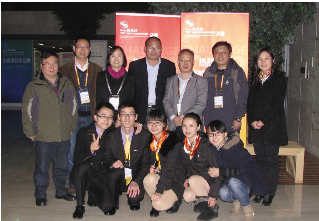
师生在“挑战杯”颁奖典礼现场。