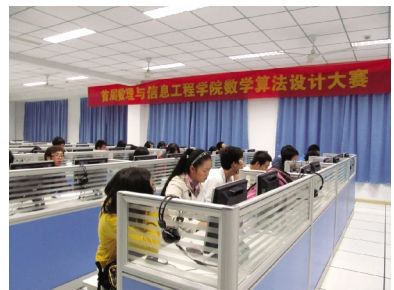
数字信息文化节·算法设计大赛

学院还通过不断延展学科竞赛平台的广度和深度,激发和培养学生的学习兴趣,形成具有共同价值取向和开展课外自主学习的良好氛围;通过推动竞赛服务的大众化,增加学生竞赛的参与度,实现重点竞赛品牌化,提高竞赛的获奖率和优秀率,扩大学科竞赛的覆盖面和影响力,进一步促进学生综合素质的提高。同时,通过学科竞赛,学院形成了注重实践、尊重科