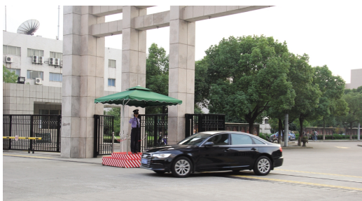
校卫队员站岗执勤

为展现校卫队伍的良好形象和崭新风貌,进一步促进校卫队伍正规化建设,提高校卫队伍的整体素质,暑假期间,对队员进行了队列训练和仪容仪表培训,强化队员的服务意识,校卫队伍的综合素质和服务能力显著提高,以全新的形象呈现于广大师生员工面前。这支队伍在维护校园秩序、治安防范、交通管理、消防安全、预防和减少违法犯罪活动方面起到了积极的作用。