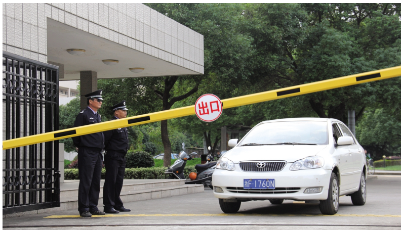
学校大门口安装的道闸