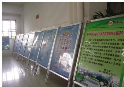
消防安全宣传教育图片巡展

实验室火灾逃生自救演练。11月28日下午,学校在生物与化学工程实验中心开展逃生自救演练活动。经济开发区消防大队参与并指导了整个演练活动,对参加演练的人员进行了灭火、疏散、逃生等方面的培训。