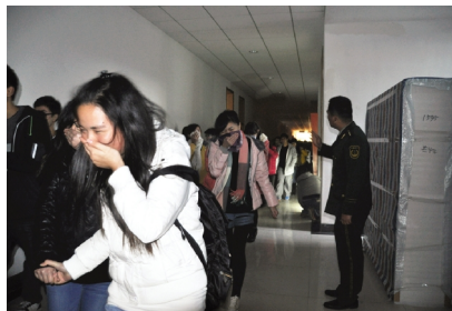
实验室火灾逃生自救演练现场