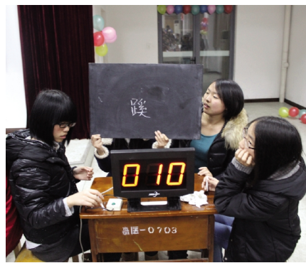
文法学院“疯狂汉语大赛”现场

“无科技不足以兴国,无文化则可以亡种。”一场场轰轰烈烈的汉语文化学习热潮顺应着时代的潮流在我们的生活中纷至沓来,唤醒着我们对传统文化的记忆,也时刻提醒着我们不忘传承传统文化的使命。