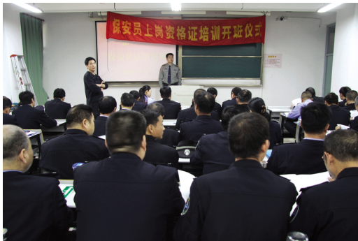
保安员上岗资格证培训班开班仪式