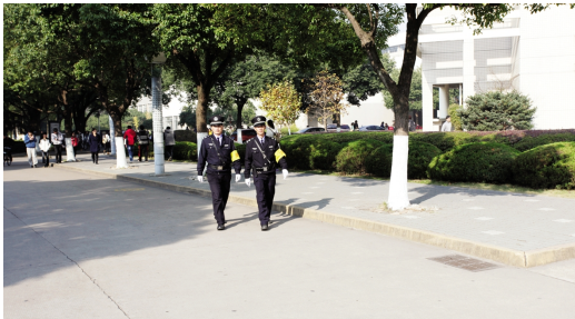
校卫队员步行巡逻