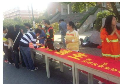
消防安全师生签名活动