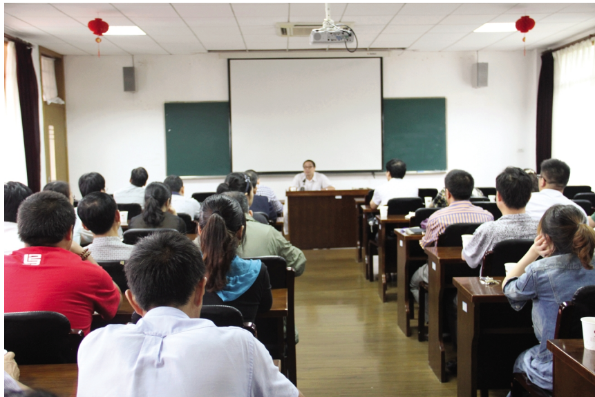
党的群众路线教育实践活动动员会

群众路线提倡说实话,干实事,避免浮夸之风;群众路线要求端正工作态度,转变工作作风,树立清风正气。“实干兴邦,空谈误国”,只有坚持群众利益无小事,始终站稳群众立场,把师生的满意作为检验工作的第一标准,才能做好本职工作,才能为后勤的服务事业蓬勃发展添砖加瓦。