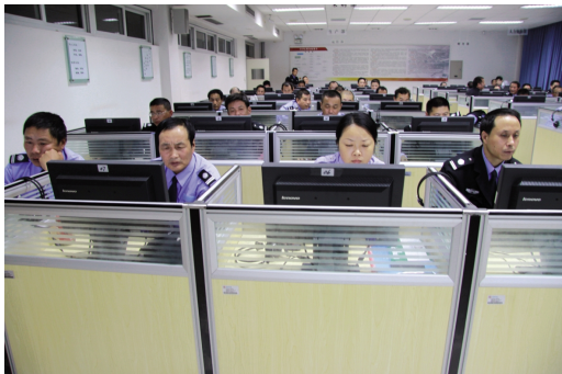
模拟考试实际操作