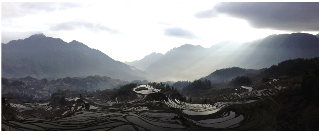
非专业组艺术类一等奖《云和日出》 英语122班 方圆