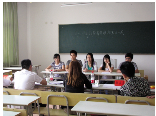
金融期货班招生面试