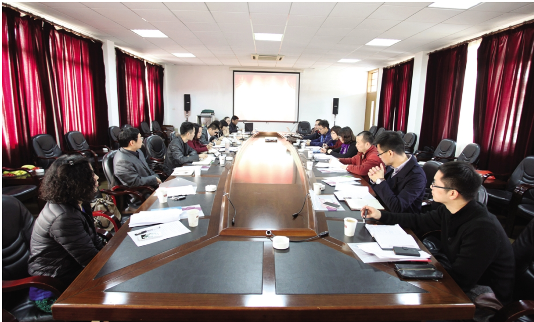
公共财政中心项目评审会