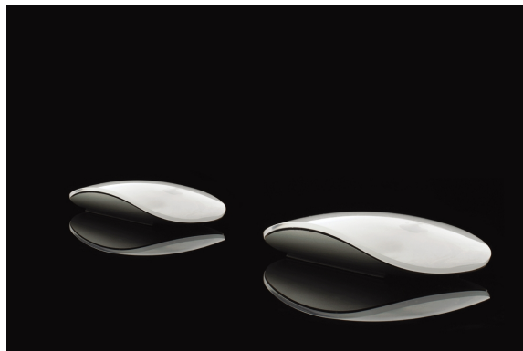
非专业组商业类二等奖《苹果滑鼠》 化工111班 徐思思