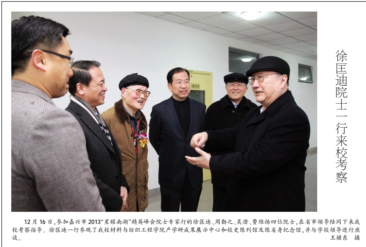
徐匡迪院士一行来校考察

陈先春在总结讲话中指出,中国共产党从“一大”的五十多个党员发展到今天八千七百万党员的历史,是我们党宝贵的精神财富。党史研究是一个一脉相承、一以贯之的过程,研究可以从不同视角进行,但最关键的是要在理论层面与学习习近平总书记系列讲话精神相结合。我们要以纪念毛泽东同志诞辰120周年为新的起点,把我们的学术和理论研究推向新的高峰,迎接建党100周年。