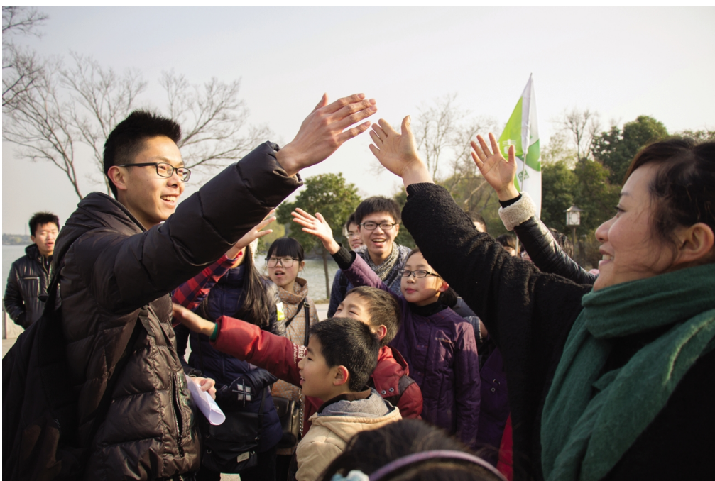
宣传 增强 亲子 低碳 生活 感情

12月15日,平湖校区举办2014届毕业生就业专场招聘会。本次招聘会吸引了近80家用人单位参加,为平湖校区2014届毕业生提供了近400个工作岗位。招聘岗位涵盖八个专业,涉及教育培训机构、企业或公司外贸员、文员、出纳、财务、物流管理人员、服装设计、平面设计等多类岗位。据统计,招聘会上有近100人已达成初步就业意向。