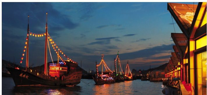
非专业组艺术类二等奖《鱼都港城之夜》 金融102班 汤竣焜