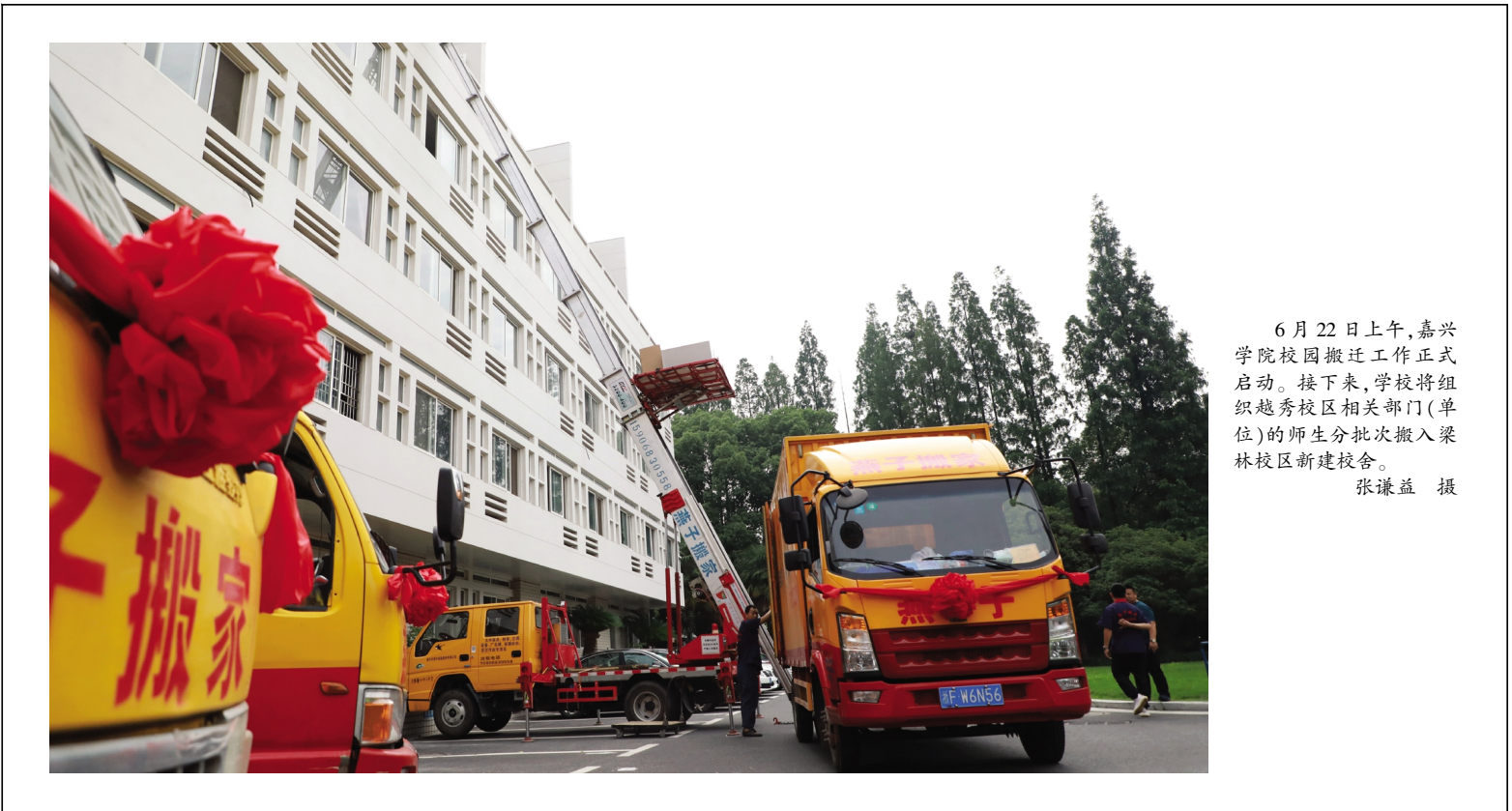
6月22日上午,嘉兴学院校园搬迁工作正式启动。接下来,学校将组织越秀校区相关部门(单位)的师生分批搬入梁林校区新建校舍。

发展规划处、教务处、学生工作处、社会合作处、人文社科处、档案馆、经济学院、商学院、法学院、材料与纺织工程学院、马克思主义学院、红船精神研究中心等部门(单位)的代表参加座谈会。