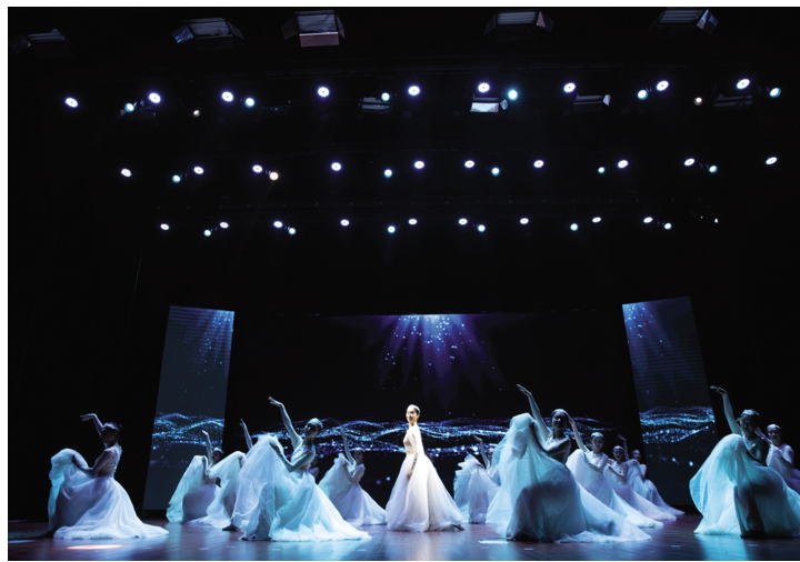
10月17日晚,“嘉院赤子同追梦 百年芳华颂初心”嘉兴学院庆祝办学107周年主题晚会在梁林校区剧场举行。本次演出主要以大型歌舞形式呈现,综合运用多种艺术手段,生动艺术地展现了嘉兴学院办学107年来不忘初心、薪火相传的壮美画卷,展现了当代大学生的良好精神风貌。

毕业20周年返校校友、学校办公室等相关部门单位负责人,各二级学院分管校友工作负责人、校友联络员参加活动。