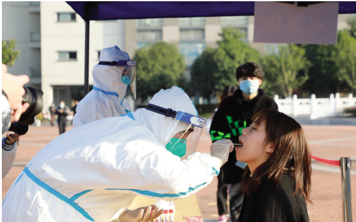
防疫不松懈 演练显担当

江高质量发展建设共同富裕示范区和嘉兴建设共同富裕典范城市,发挥嘉兴城乡统筹先发优势和学校多学科发展优势,于2021年3月在国内率先成立的围绕中国扎实推进共同富裕开展研究的学术平台。研究院以“共同富裕”为特色研究领域,以共同富裕相关理论与现实问题为主要研究方向,致力于建设新型专业智库,打造展示嘉兴声音、浙江经验和中国共同富裕理论与实践创新的“重要窗口”。