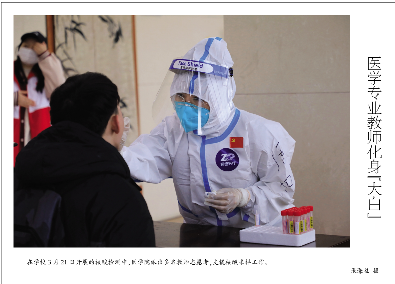
在学校3月21日开展的核酸检测中,医学院派出多名教师志愿者,支援核酸采样工作。